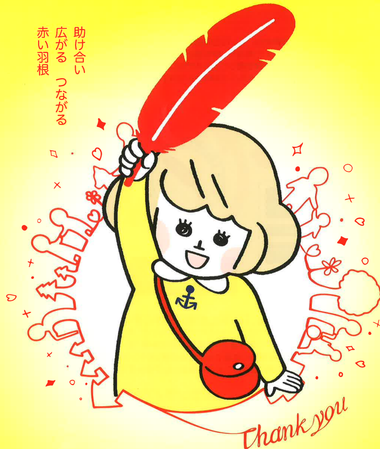
[令和4年度共同募金運動ポスター]

赤い羽根共同募金は、県内の福祉活動を支援する地元で根ざした募金です。寄せていただいた募金は、あなたの町の子どもたち、高齢者、障害者などを支援するさまざまな福祉活動に役立てられます。災害時には、被災者を支える活動にも役立てられます。