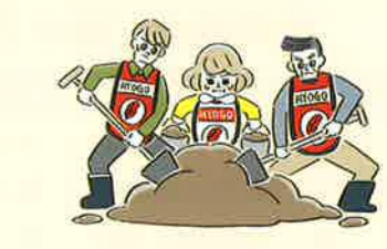
災害発生時のボランティア活動の支援に