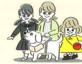
障害者支援の活動に