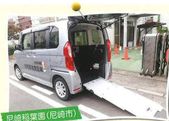
尼崎稲葉園(尼崎市)

赤い羽根共同募金の配分を受け、スロープ付きの新しい車両に買い替えることができました。施設利用者の皆様の移送や日用品の買出しなどで活用させていただきます。ありがとうございました。