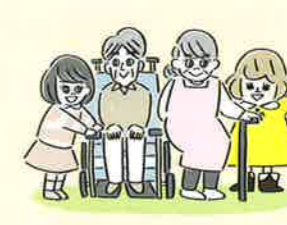
地域交流や多世代交流の活動に