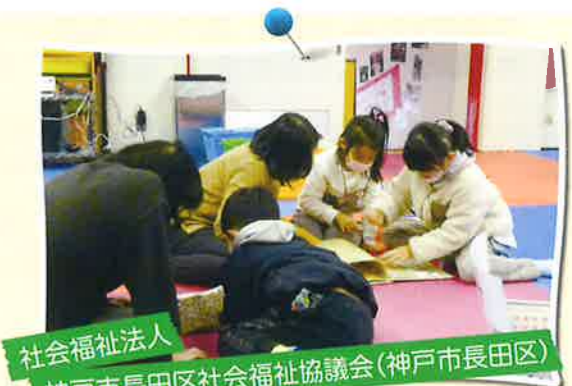
社会福祉法人 神戸市長田区社会福祉協議会(神戸市長田区)

赤い羽根共同募金の配分を受け、スロープ付きの新しい車両に買い替えることができました。施設利用者の皆様の移送や日用品の買出しなどで活用させていただきます。ありがとうございました。