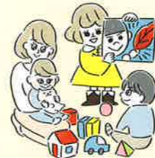
子育て支援の活動に

赤い羽根共同募金により、沢山の子どもたちに楽しんでもらうための絵本を購入し、感染対策を行いながら、読み聞かせなどを行いました。ありがとうございました。